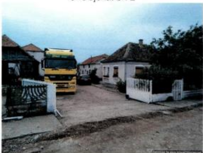
5. Objekti br.1 i 2