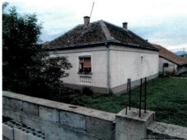
2. Objekat br. 1