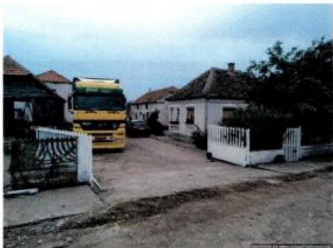
1. Objekti sa ulice